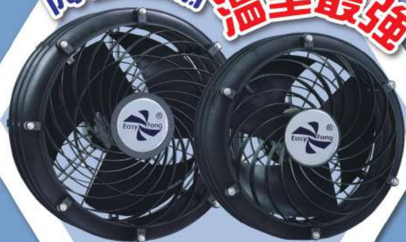
● A22P3 ● A18P3