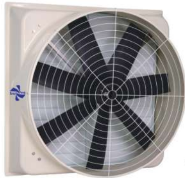
● D54P7E ● D46P7E ● D42P7E