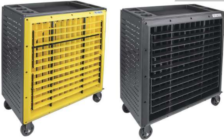
規格參數 ▶ 30吋DC變頻風扇工具車 30吋AC調速風扇工具車