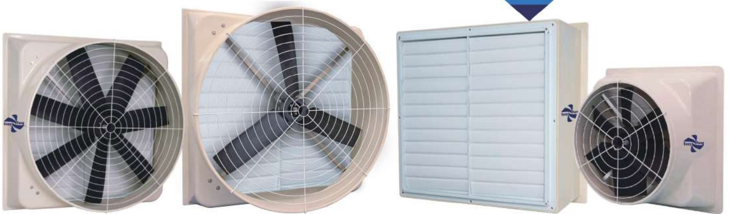
● S42P7 ● S46P7 ● S54P7