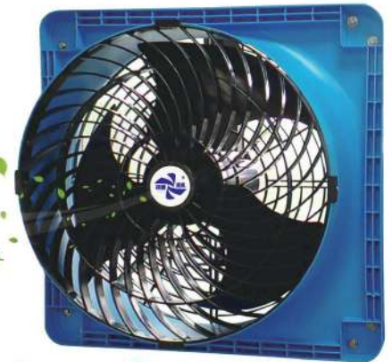
● A24P3 ● A24P3E