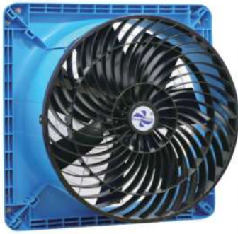
規格參數 40寸七葉DC循環扇 40寸七葉伺服循環扇