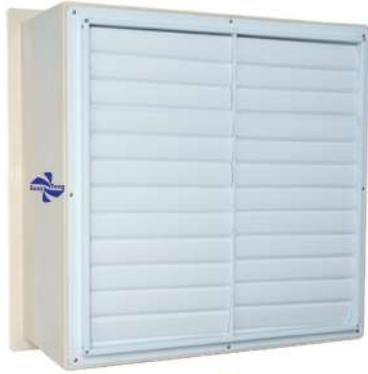
● D54LP7E ● D42LP7E